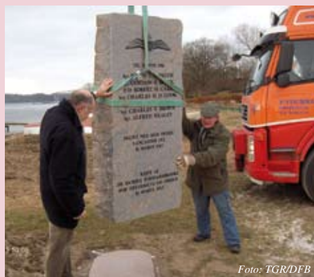
Herover, mindestenen løftes på plads fredag den 22. februar 2013.