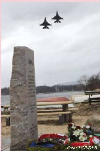
Æresoverflyvning af to F16 jagere under afsløringen den 10. marts 2013.