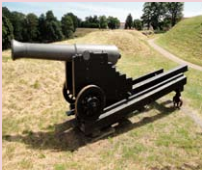
24 punds Kugle Kanon opstillet i Prinsessens Bastion