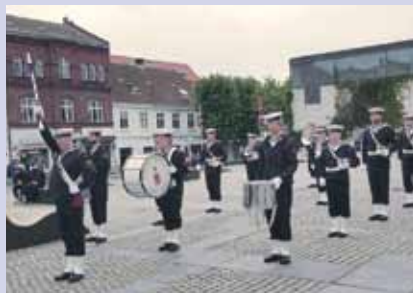
Søværnets Tamburkorps ved Rådhuset.