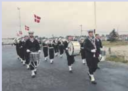
Søværnets Tamburkorps ved havnen.

5. september Danmarks Nationale Flagdag: Dagen blev en forrygende oplevelse, hvor Forsvarsbrødrene i høj grad var med til at sætte dagsordenen både før og under afviklingen. Dagen før fik byen som bekendt besøg af byens ”adoptivbarn” fregatten Iver Huitfeldt samt af Søværnets Tamburkorps. DFB Fredericia deltog på dagen med vores fane i det mest forrygende blæsevejr, så fanebærerne fik brug for alle gode kræfter. Ud over alle flag ceremonierne var der også åbnet hus på fregatten, et tiltag som der var rigtig mange der benyttede sig af.