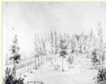
Trinitatis Kirke og kirkegård i juni 1849. På dette tidspunkt rummede graven syv officerer fra Gudsø, Kolding og Fredericia. I alt 60 blev begravet her under belejringen. Antallet blev kraftigt forøget den 8. juli, to dage efter 6. Juli Slaget, med 22 officerer og 372 menige. TEGNING AF C. M. TEGNER. LOKALHISTORISK ARKIV, FREDERICIA.

Det er samtidig Komiteen en glæde, at de to Sørgemarskalstave er fremstillet lokalt, idet forespurgt virksomheder med speciale i faner ikke har kunnet klare opgaven. Værksteder på Depotgården trådte derfor beredvilligt til, og har dermed bidraget således, at den nye tradition kan indføres i 6. juli processionen.