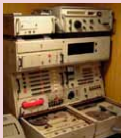
Mixerpult med KB modtager øverst th.

Det er også sandsynligt, at båndoptageren kunne kobles på ”spionsenderen”, så den kunne bruges til jamming af ”fjendens” kommunikation (støjsender). Samme type båndoptager blev under den kolde krig anvendt på en stor russisk jammer i Litaun.