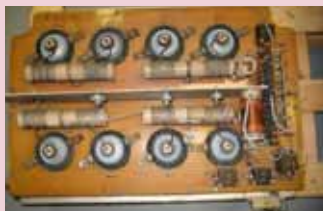
Senderens PA-trin m. 8 stk. GU-74

”Brig” senderen (ВОЗБУДИТЕЛЬ «БОТ») fra ca. 1971 er af synthesizer typen og dækker frekvensområdet 1,6 – 30 MHz, med en opløsning på 100 Hz. 1,6 – 3,8 MHz 400W, alle øvrige frekvenser min. 1,5 KW. Den kan sende med alle kendte modulationsformer, incl. RTTY (kontinuerlig bærebølge). Senderen er ”robust” dimensioneret. De 8 stk. GU-74 er specificeret til hver at kunne give min. 550W.