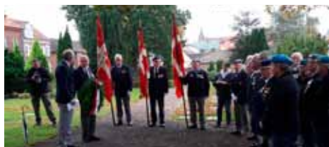
Kranselægning Trinitatis 10-03-2017

Enhver, som er ved Arbeide i eller uden for Krud-Taarnene, bør forrette sin Gierning med sådan ærbødig Stilhed, som det sømmer sig på et Sted, hvor (ifald den allerhøieste Gud ikke selv i Naade holder sin Haand over Arbeidet) den mindste Uforsigtighed ikke alene kan forvolde alle Tilstedeværende Livs forliis, men endog Al mueligste Varsomhed og forsigtighed ved Krudets behandling, nøie efterlevende alt hvad til den Hensigt befales og erindres. Forbydes tillige alle og enhver på det skarpeste og alvorligste, hvad enten de ere ved krudets Behandling eller dets Transport, enten af fortredelighed under Arbejdet, og endnu langt mindre af Letsinghed, at lade udgaae af deres Mund nogen Eder og Bander, eller nogen letsindig eller liderlig Snak, hvorved den Allerhøiestes Navn bliver vanæret og fortørnet, da saadanne, som deri befindes at have været overhørig og forbrudt sig, uden nogen Overbæren eller Undskyldning strax skal afgaae fra sit Arbeide, og overleveres Skildvagten til forvaring indtil Arbejdet er forbi, hvornæst de i Arrest hensættes, for efter Rettens Kiendelse at lide Dom for sin forbyrdelse.