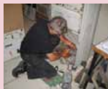
Klargøring af sender.

Det lykkedes teknikerne i Fredericia at få begge modtagere til at fungere. Senderen kørte kun i nogle få minutter, så var der gennemslag i den store 3 fasede transformator. Den havde trukket fugt.