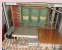
Transformator og strømforsyning.

Samlingen i Fredericia er p.t. under etablering i nye lokaler.