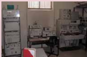
Udstyret fra spionskibet i Fredericia.