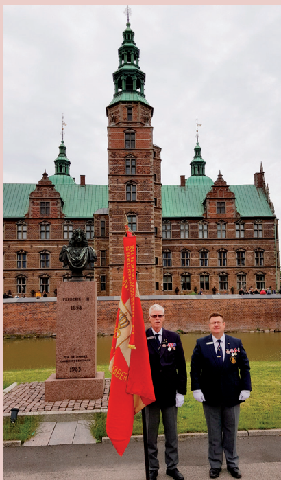
Den nye fane i brug, samt vore udsendte til København, Rosenborg.